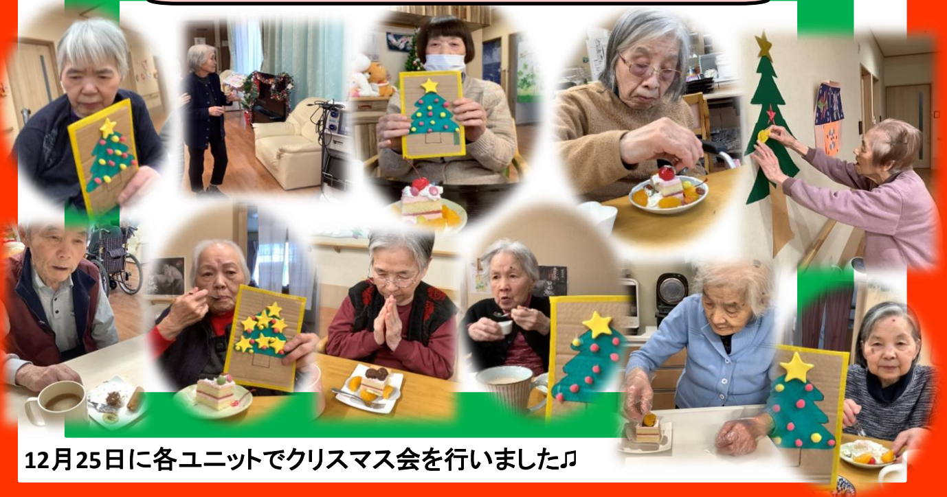
12月25日に各ユニットでクリスマス会を行いました♪