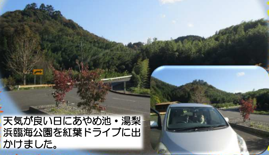
天気の良い日にあやめ池・湯梨浜臨海公園を紅葉ドライブに出かけました。