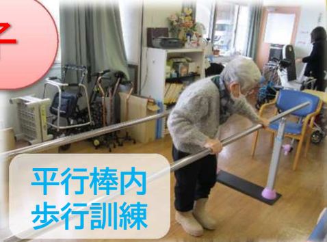
平行棒内歩行訓練