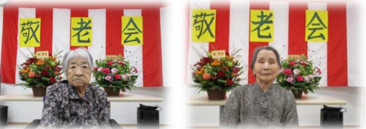
はなみユニット 最高齢ご利用者

9月13日に敬老会を行いました。 ご利用様の益々の健康を願って、長寿をお祝いしました。 式典では施設長がお祝いのことばを送り、それを聞き喜ばれている姿が印象的でした。