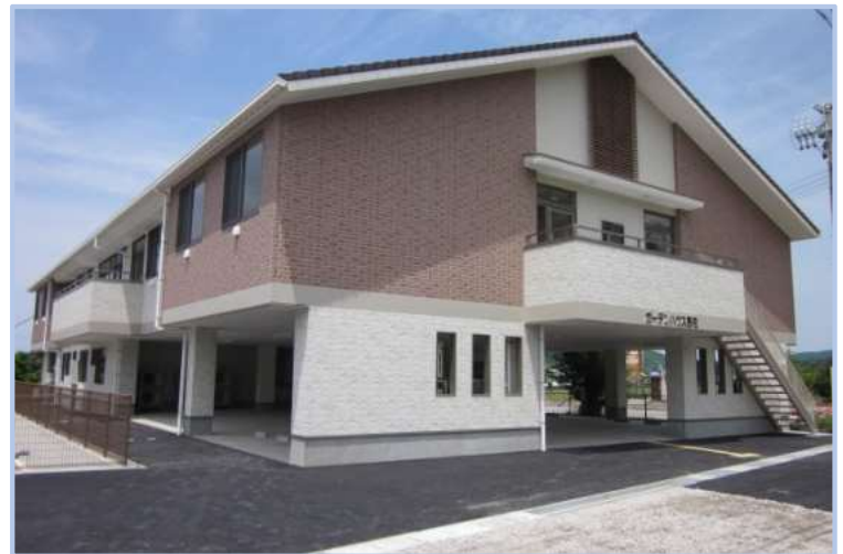
ル・サンテリオン東郷の南側に隣接しています