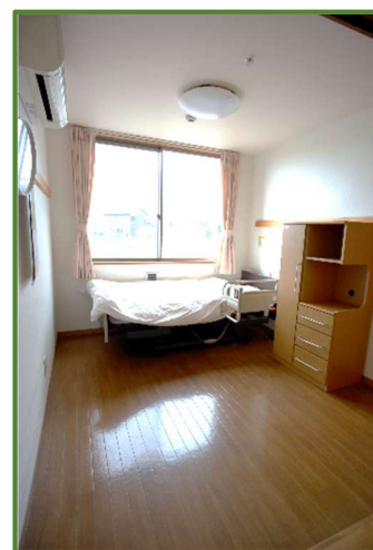
1日あたり7名まで 宿泊できます