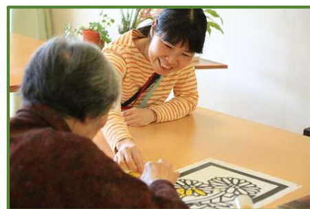
日中は個々の希望に応じた活動の他、 外出イベントやレクリエーションなどを行っています。