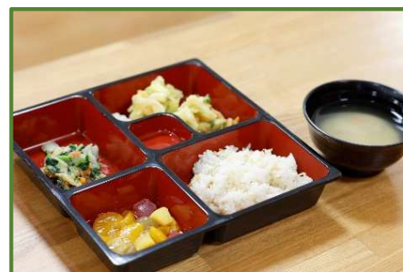
お弁当をご自宅まで 配達することも可能です