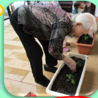
ちょっと小さいかなー