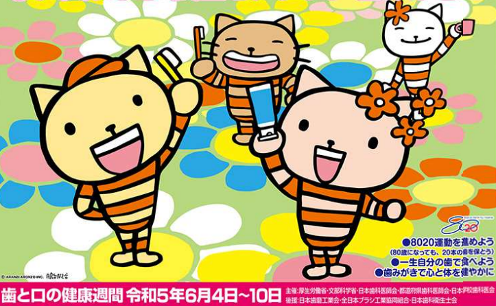
令和5年の啓発ポスターです