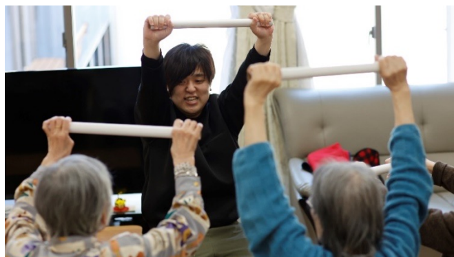
皆さんで体操などを楽しみます