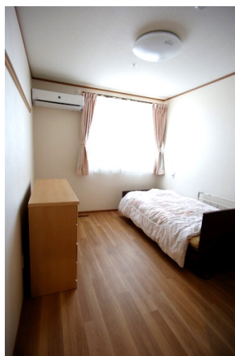
居室のタイプは2種類 (トイレ有・無)です