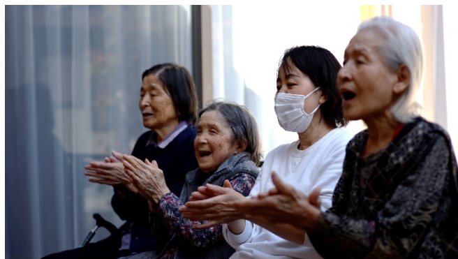
天気の良い日は中庭で季節を感じます