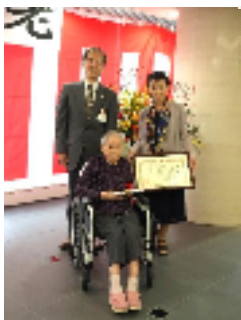
いつもお世話ありがとうございます

ご利用者様には、健康に留意され、末永く元気にお過ごしください。職員一同、心よりご祈念申し上げます。