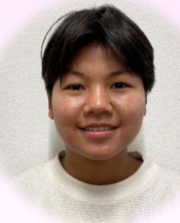
てってっわい テツテツワイ 部署：療養課3階