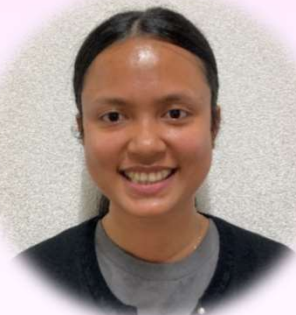
るいん るいん みよー ルインルインミョー 部署：療養課2階