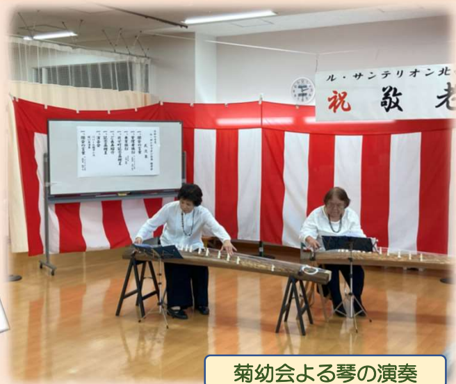
菊幼会よる琴の演奏