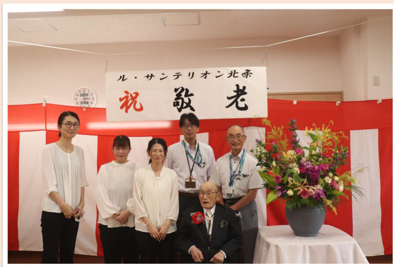
ル・サンテリオン北条 最高齢