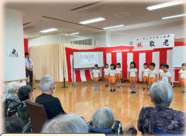
ババール園の園児たち