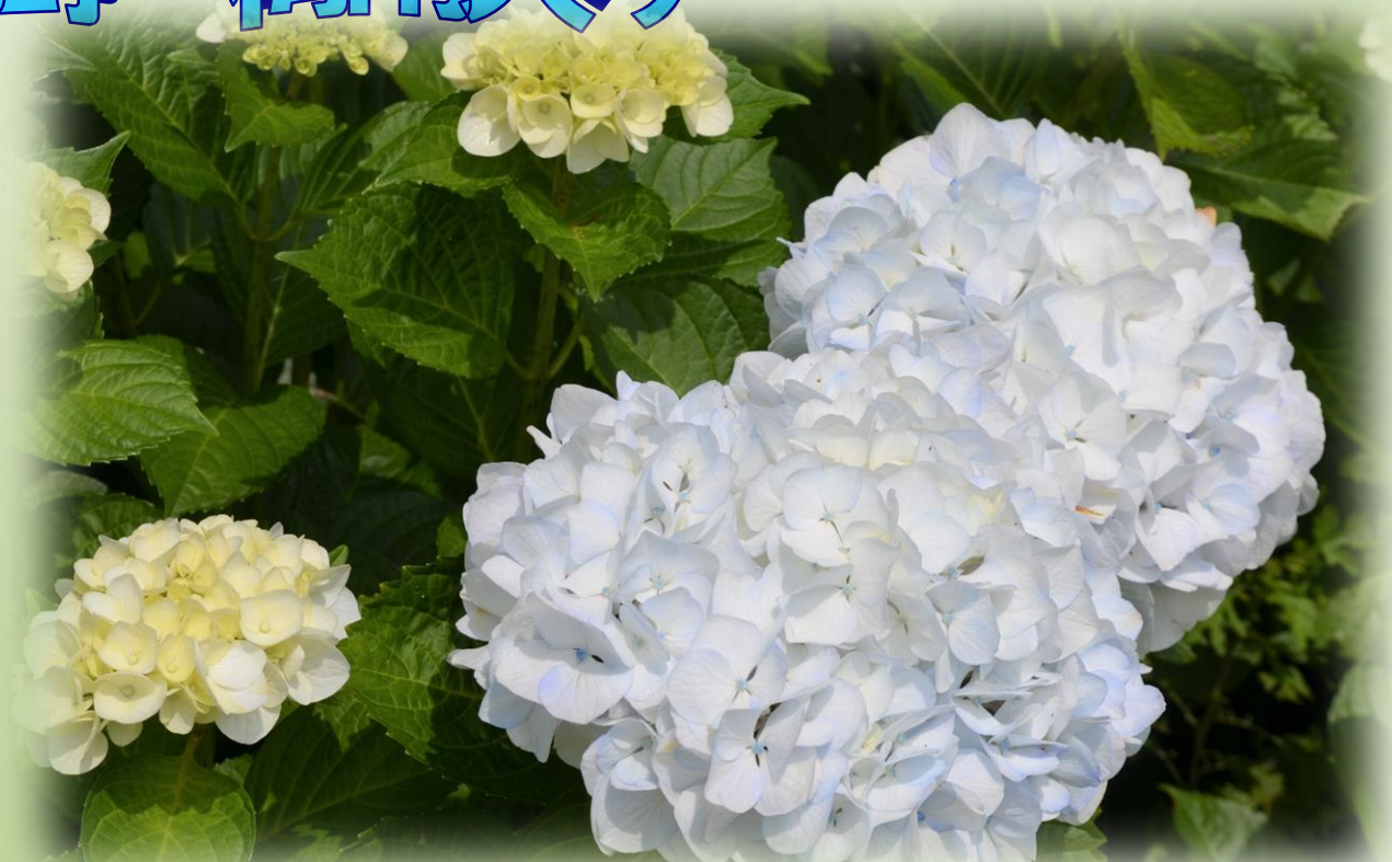
【写真：鳥取市立逢坂小学校前のあじさい】