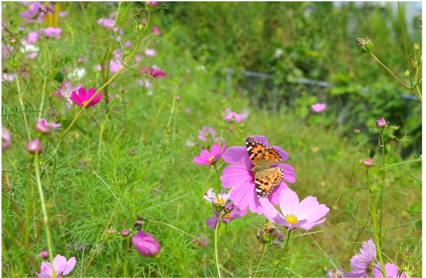
鹿野町閉野道路横 コスモス

先月号はお休みさせていただいて、今月号は広報誌の規模を縮小して作成しています。各部署の活動報告を楽しみにされておられた方々におきましては、大変申し訳ございません。次号からはこれまで通りの広報誌を作成できるよう努力してまいりますので、今後ともよろしく願いいたします。