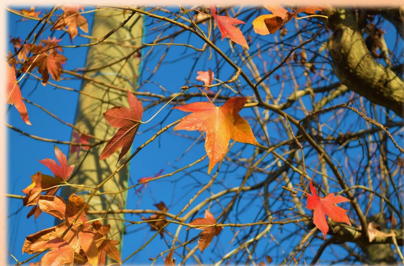
秋晴れに映える紅葉 【写真：ル・サンテリオン鹿野敷地内】

内閣府所轄の一般財団法人中国地方郵便局長協会様より車椅子搭載用福祉車両1台を寄贈していただきました。11月4日に贈呈式を行いました。ピカピカの新しい車で、送迎や外出支援を行っていきます。大切に使用させていただきます。ありがとうございます。 (さっそく従来型2階の紅葉ドライブで活躍しました！)