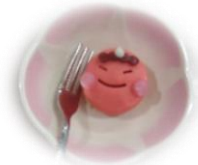
おやつはかわいい鬼のお饅頭