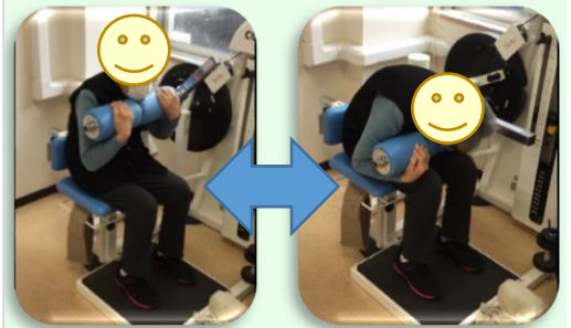
パワーリハビリで筋力増強！