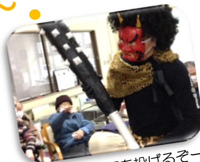
鬼が来たー！！豆を投げるぞー！

通所リハビリ（介護）で節分会を行いました。節分の由来などの話を聞き、「初めて知ったなあ～」など感心していると、鬼が金棒を振り回しやってきました。新聞紙を丸めて作ったものを豆に見立て、鬼に向かってみんなで投げつけました。その後、皆さんで作った鬼を的にしたゲームをしました。中には立ち上がって投げる方もおられました。邪気を払い、健康な一年を過ごしたいですね。