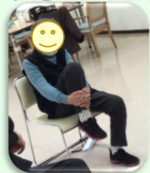
入念に足の柔軟体操

Aさんは予防通所に通い始め、お風呂で足先が洗えるようになり、「前は届かなかったのに自分で洗えて嬉しい。」と話して下さいました。柔軟体操や筋力増強運動を実施し体の動かせる範囲が拡大し、リハビリの評価でも握力や歩行スピードがアップするなど身体機能面が向上されました。現在は「もう少し早く歩けるようになりたい！」と次の目標を掲げハビリに励んでおられます。