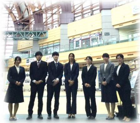
米子東病院の発表者と 一緒に記念撮影