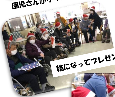
輪になってプレゼント交換