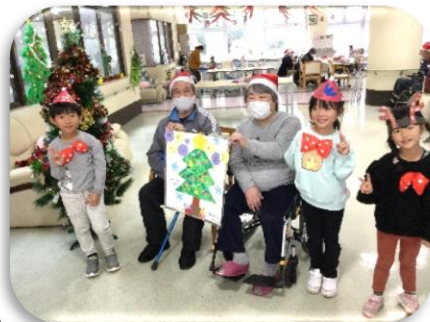
園児さんからもプレゼントをいただきました