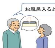
お風呂入るよ 入浴前に家族に一声掛けておく