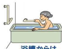
浴槽からは ゆっくり立ち上がる