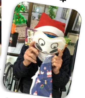
プレゼント交換で何が当たったかな？