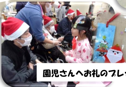
園児さんへお礼のプレゼント