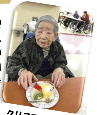
クリスマスケーキ