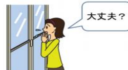
大丈夫？ 高齢者の入浴中は注意しておく