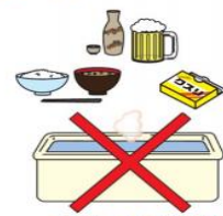
食後・飲酒後は 入浴禁止