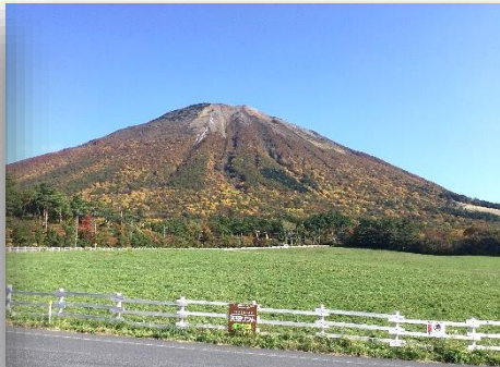
晴天に恵まれ絶景でした