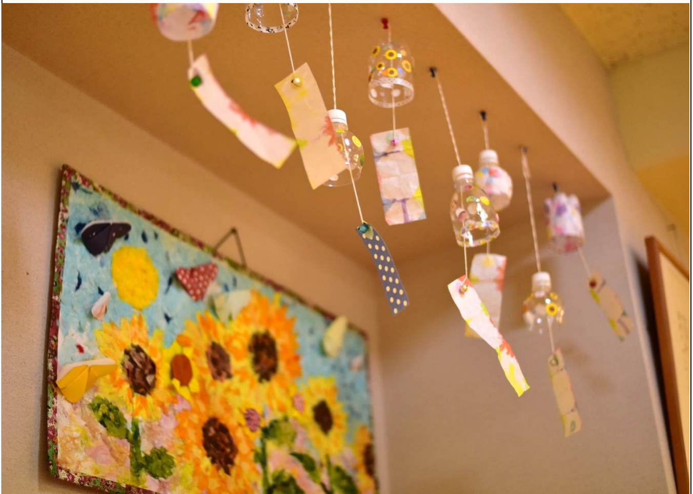
写真：ユニット西2階ご利用者制作「ひまわりとペットボトル風鈴」