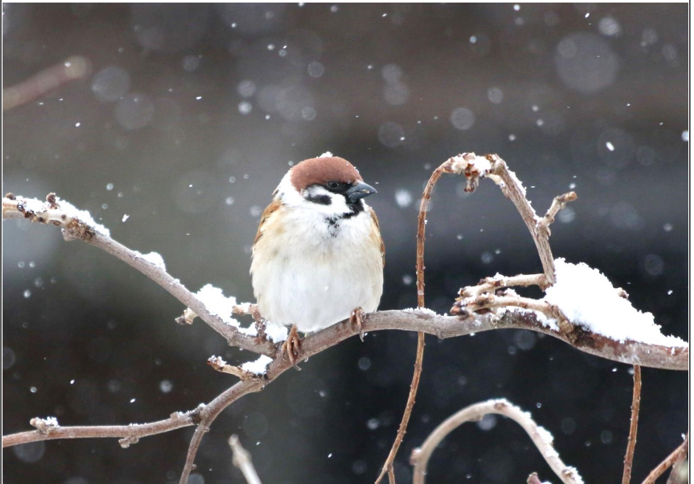
写真：ふっくら冬仕様の雀 撮影者：Y.K