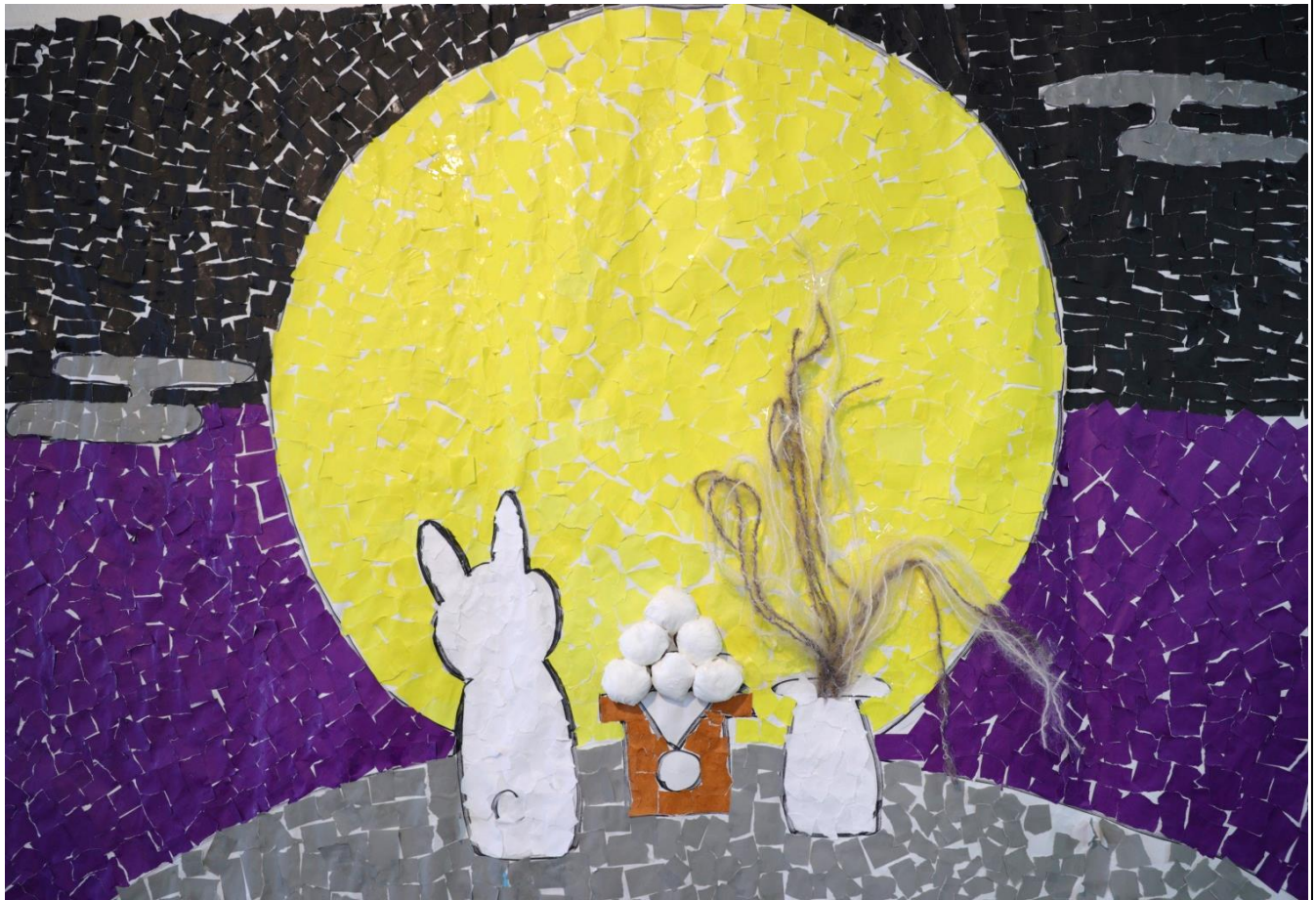
写真：お月見（ゆうゆう棟ご利用者の作品）