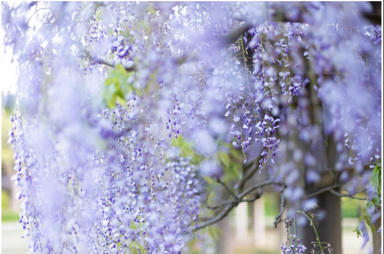
写真：東郷湖羽合臨海公園あやめ池公園の藤の花