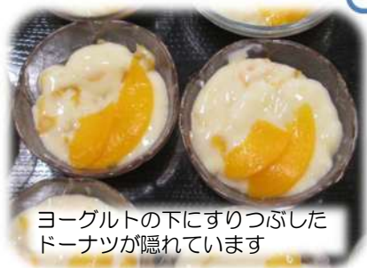
ヨーグルトの下にすりつぶした ドーナツが隠れています