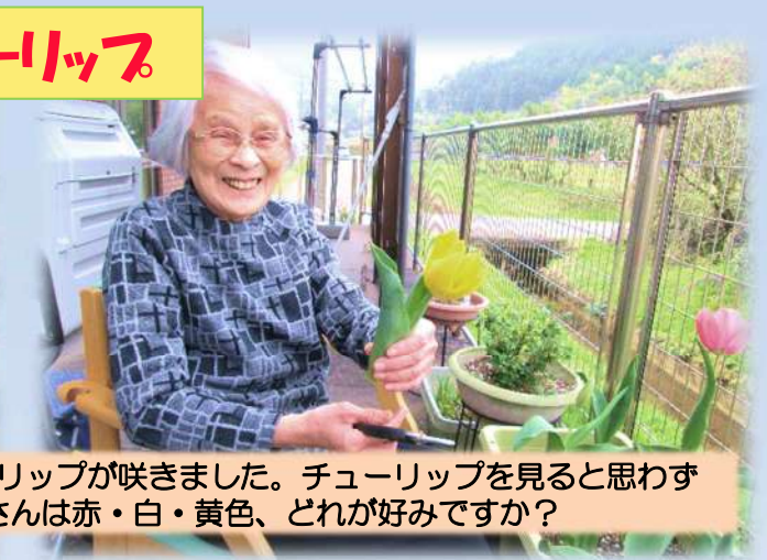
グループホームのベランダで育てていたチューリップが咲きました。チューリップを見ると思わず歌を口ずさんでしまう方が多数！皆さんは赤・白・黄色、どれが好みですか？