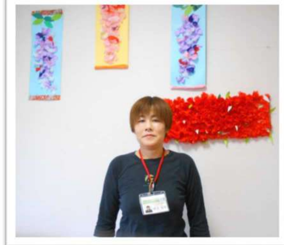
桶本ケアワーカー