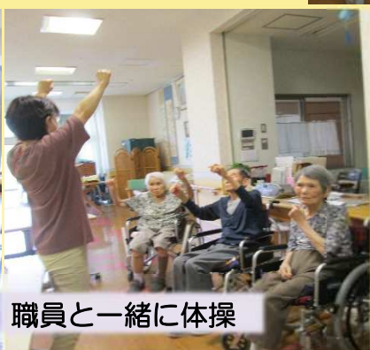
職員と一緒に体操