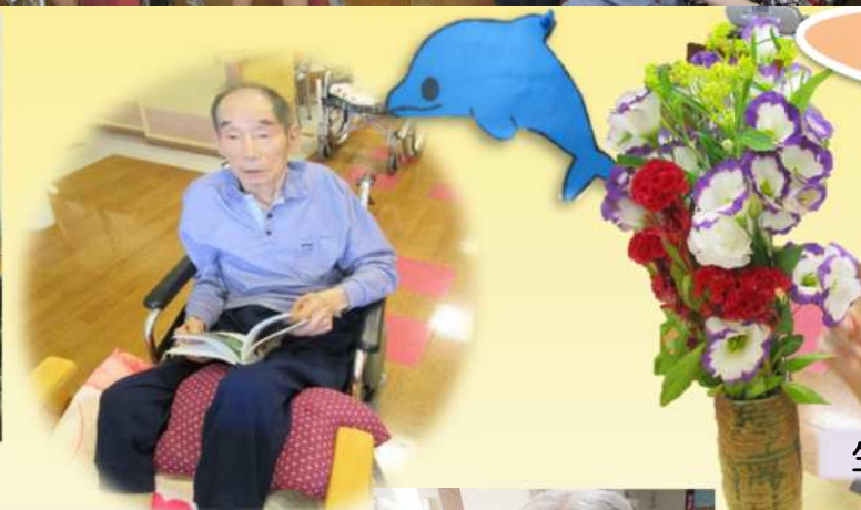
両膝伸ばしストレッチ をしながら読書