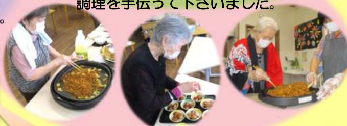
美味しそうだわあ～