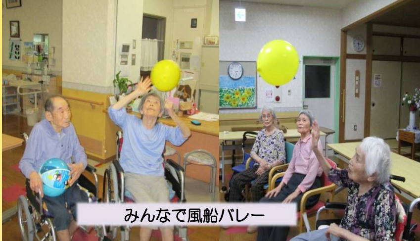
みんなで風船バレー