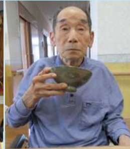
お抹茶をたててもらい、和菓子を食べられました。「久しぶりでできるかな～」と心配されてましたが手際よくされていました。