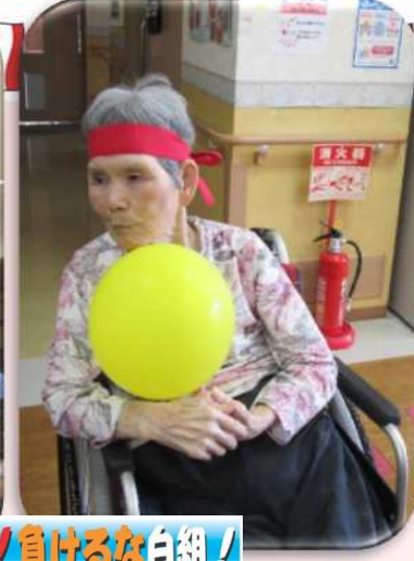
がんばれ赤組！負けるな白組！