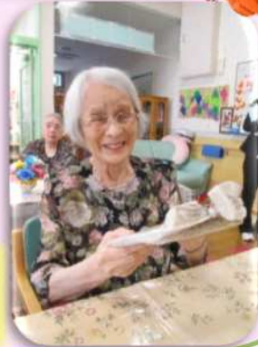
9月下旬に敬老のお祝いをしました。職員手作りのアルバムを手渡し、喜んで下さいました。