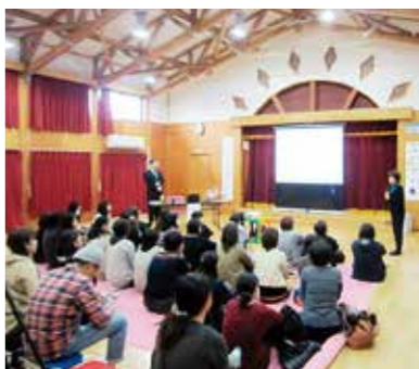
でいただきました。

講演後には、ミニ音楽会と題して、園児の合唱や演奏を披露し、楽しんでいただきました。