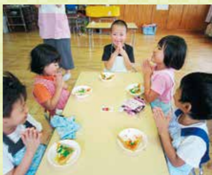
たくさん食べておおきな〜れ

食物アレルギーを持っている園児さんもおられ、アレルギー食品の除去や代替品を使用した代替食を提供しています。毎月、保護者の方、保育士と除去