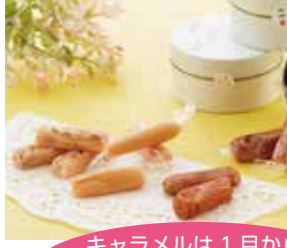
キャラメルは1月から販売開始しています。ぜひお買い求めください。

11月26日(土)、神戸ハーバーランドを会場に「第8回スイーツ甲子園関西大会」が開催されました。あずさパン工房は新たに商品開発した「もりのみキャラメル」を出品し、鳥取県代表としては歴代最高位となる準グランプリを受賞しました。