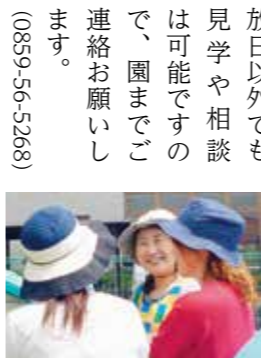
子育て相談を受ける保育士

今年度はこれまでに9回の園内開放を実施しましたが、園の様子を知ったことで入園や一時預かり保育を希望される方も増えています。今年度はあと1月20日、2月22日、3月13日に予定しております。園内開放日以外でも見学や相談は可能ですので、園までご連絡をお願いします。