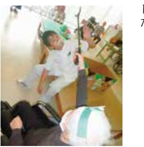
お菓子で釣れたぞ〜!!

うなりハビリの要素も多く取り入れられました。普段ベッド上で過ごす時間が長い患者さんにも応援団として参加していただき、たくさん笑顔を見ることができました。「また、みんなで集まって何かしたい」「運動会なんて何十年ぶり!!」など嬉しい感想もいた