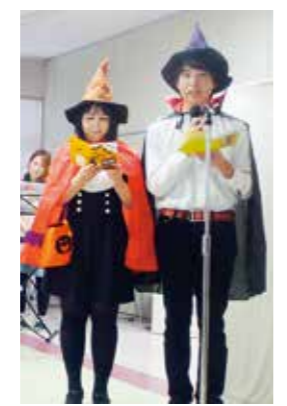
魔女とドラキュラの司会者

ル・サンテリオンよどえの説明を行いました。また、インボディによる筋肉量や体脂肪率などの測定も実施し、多くの方に喜んでいただきました。今後も、医療と福祉が連携し、地域の方に喜んでいただけるイベントを行っていききたいと思います。