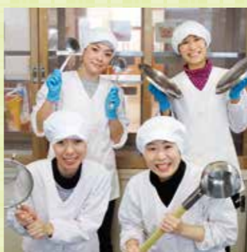
私たちが作っています

給食の時間が楽しく喜びのあるものとなるよう、安心・安全な給食を提供していきたいです。