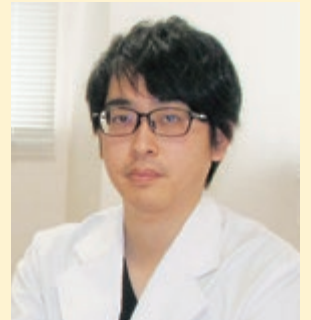
医療福祉センター倉吉病院 医局長・精神科