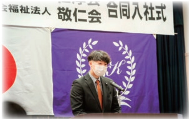
先輩職員激励の言葉