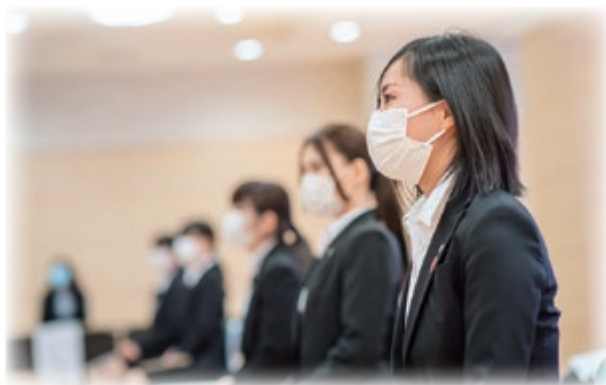
真剣な眼差しの新入職員