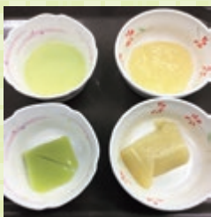
パースト食・ムース食

厨房では常菜・一口大・きざみ食・超きざみ食・ムース食・ペースト食と様々な食事形態があるため、老健と同じようにグループホームのご利用者一人ひとりに合った食事が提供できるようにになりました。