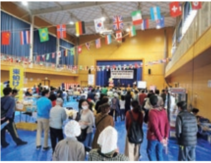
感謝祭の様子 (令和元年度)

コロナ禍において、人々の生活様式が大きく様変わりしました。当施設でも、ご利用者外出・地域交流活動・作業生産活動な