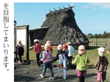
伯耆古代の丘公園にどんぐり拾いへ

地域社会の中で「豊かな心を育み、自立へと導く」ための保育を行うとともに、校区の小学校との連携の強化を図り、学ぶ力を持つ健やかな子どもを育みます。子育てについては、保護者へ寄り添う支援を行います。また、公民館行事等への参加を通じて地域や保護者に信頼される保育園