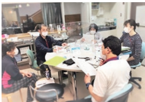
チームワーク向上中

2040年を視野に地域包括ケアシステムから共生社会の実現を目指すと共に、自立支援・重症化防止の取組みを進めながら、各専門職のスキル向上、ICT・介護ロボットの活用による業務効率を図り、感染症や災害があってもご利用者に必要なサービスが継続的に提供できるよう体制の構築に努めていきます。