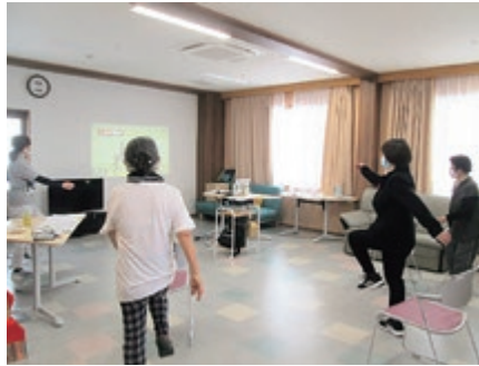
脳活トレーニングの様子

多機能施設としてご利用者の福祉ニーズに幅広く対応し、住み慣れた地域で安心して暮らせるように包括的に支援します。また、湯梨浜町委託事業である「筋トレ」に続き、今年度は本格的に認知症予防プログラム「脳活トレーニング」をグループホームゆりはまにて行い、認知症予防に取り組みます。