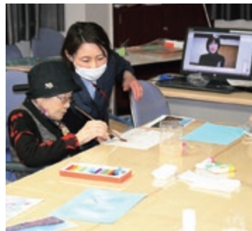
オンラインでの臨床美術