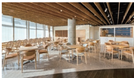
調理や接客を通して、障がい者の働く力を育む「もりのみかフェ」（就労支援B型事業）

倉吉病院との密接な連携のもと、地域の中で孤立している方が気軽に相談できる窓口を設置するとともに、退院後の地域生活をサポートするための在宅サービスの充実を図ることにより、障がいがあっても、お一人お一人