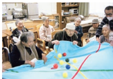
認知症予防ゲームの様子

事業継続目的と質の向上を目指し「認知症ケア」「感染症や災害」「リスクマネジメント」「虐待防止」への対応を強化いたします。またICT等活用しながらご利用者ご家族をつなぐ支援を行い、安心と満足を提供すると同時に現状把握もしていただけるよう努めます。