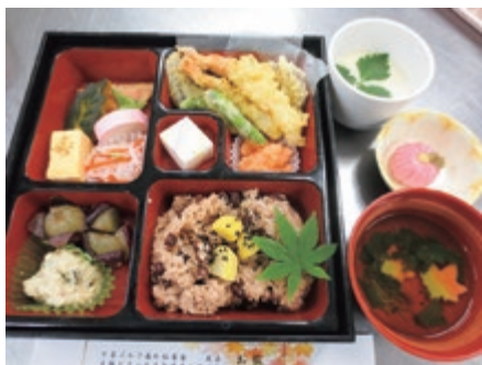
敬老会お祝い御膳（よどえ厨房）

喜ばれる食事の提供の為、安全で美味しい食事提供はもちろん、面前調理等を通しご利用者の顔がわかる関係を築き、その人たちを想いながら調理ができる職員の育成を目指します。自然災害や感染症など災害発生時にも即応できる強い厨房をつくります。