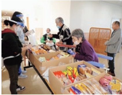
臨時の売店オープン

コロナ禍で外出自粛してられるご利用者に、少しでも楽しく過ごしていただけるよう臨時の売店をオープンしました。安心して利用していただけるよう感染対策に努めていきます。また、居宅訓練事業用アパートの空き部屋を活用して、生活困窮者支援の推進を図ります。