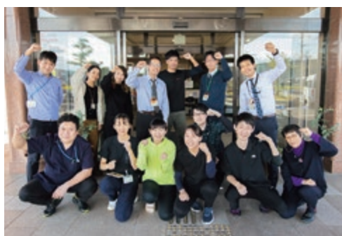
職員の笑顔があふれる事業所です

開設から20周年を迎える節目の年。地域ニーズに応えるため介護予防、医療度の高い方の受入、通所リハビリ改革等に取り組みます。また、ケアの質を見える化する試みもスタートし、根拠のあるケアを提供できるようICT技術