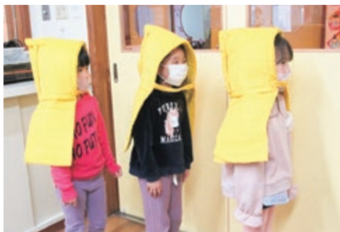
地震による避難訓練

指定管理4年目となり、再来年の指定管理期間の満了に向け、倉吉市等と協議を行うべく同時に、地域や保護者との信頼関係を構築するため質の高い保育サービスに努めます。また、防災対策の強化を図り自然災害への備えの見直しを行い、安全で安心な保育環境を目指します。