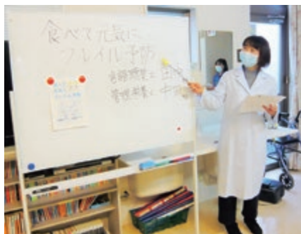
フレイル予防への取組

さらに、フレイル予防の推進、医療度の高いご利用者の受入、重度心身障がいをお持ちの方の医療型短期入所受入など、地域から求められる事業所づくりを目指します。