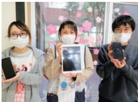
iPodtouch や ipad で連絡帳もラクラク!