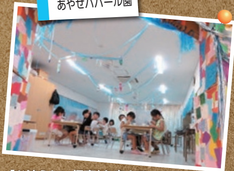
「お泊らない保育」を夜まで思い切り楽しみました。