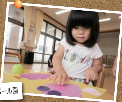
指先を使っておいしそうなぶどう製作