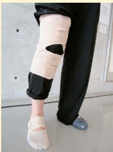
【装具療法】 患者さんの状態に合わせて処方します