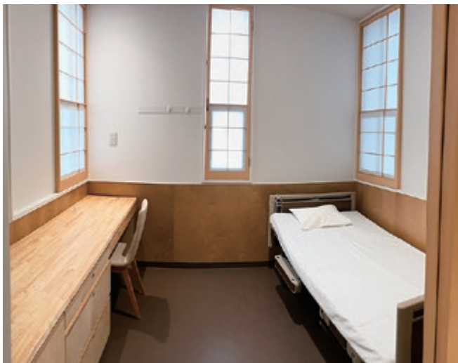
落ち着いた雰囲気の部屋

神経症やうつ病などのストレス関連疾患の方にリラックスできる環境の中で療養していただきながら、医療の専門職が精神療法・薬物療法・作業療法・認知行動療法などの集中的な治療を行い、その回復の過程をしっかりとサポートしてまいります。