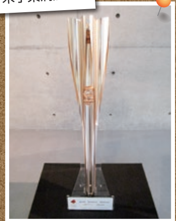
桜をモチーフとした東京2020オリンピックトーチ展示