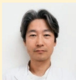
米子東病院 整形外科 リハビリテーション科 副院長