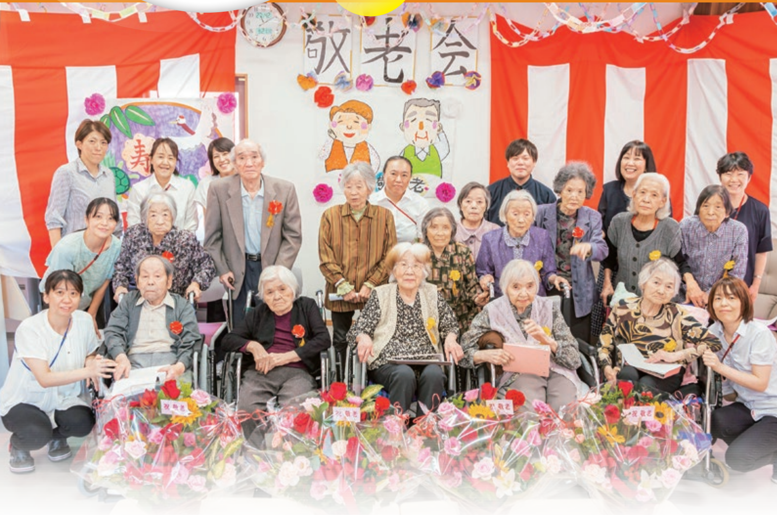
みんなで笑顔(グループホームゆりはま)

仁を以ってかかわるすべての人たちの 幸せを追求し、 地域社会とともに歩み続けます。