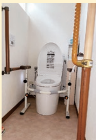
【生活環境調整】 トイレに手すりを設置することで安全性と快適性がアップ

変形性膝関節症は早期に治療を開始することで痛みを軽減すると同時に、病気の進行を遅らせることができます。膝の痛みの原因となる病気は他にもいろいろあります。痛みの原因を知り適切な治療を受けるためにもまずお近くの整形外科を受診しましょう。