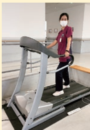
【運動療法】 ウォーキングマシンを使ったトレーニング