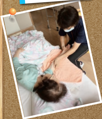
「アロマセラピートリートメント」を実施しています。