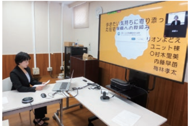
発表者による事前録画の様子

仁厚会・敬仁会では平成28年度から毎年「医療福祉学会」を開催してまいりましたが、前回、前々回とも新型コロナウイルス感染症の影響で開催が中止となっておりました。今年度は、何とか「医療福祉学会」を開催できないかと試行錯誤した結果、Webで開催することにしました。