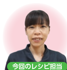
今回のレシピ担当