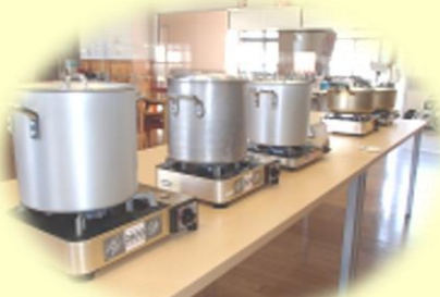
鍋で炊飯中・・・