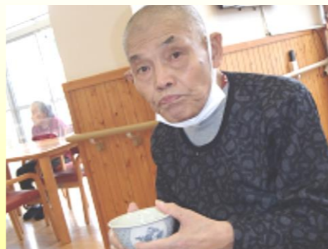
抹茶はうまいなあ