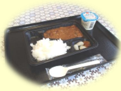
炊き出しカレーの出来上がり♪