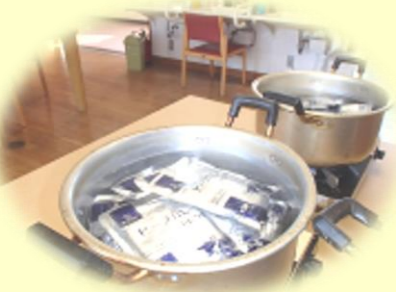
レトルトビーフカレー