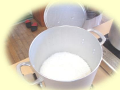
ふっくら炊き上がりました！