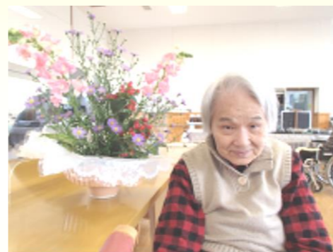
お花クラブ楽しかったわ

感謝の気持ちを「ようこそ、ようこそ」とお話しして下さる利用者の方の、お言葉を頂き、このタイトルを付けさせて頂きました。みなさん、「ようこそ、ようこそ」