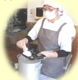
トレーに盛り付けます