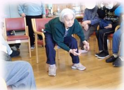
ストライクを狙って…

感謝の気持ちを「ようこそ、ようこそ」とお話しして下さる利用者の方の、お言葉を頂き、このタイトルを付けさせて頂きました。みなさん、「ようこそ、ようこそ」