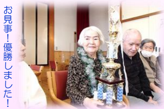
お見事！優勝しました！