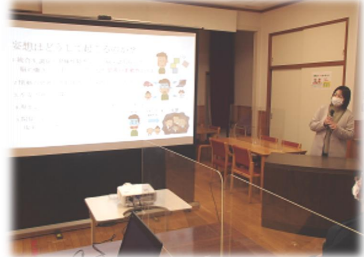
研修の一場面「妄想はどうして起こるのか？」