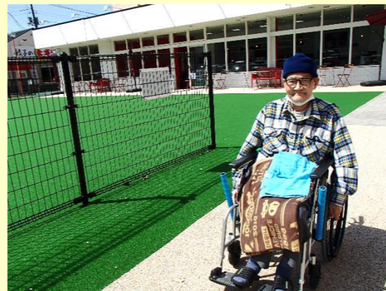
期日前投票してきたよ。