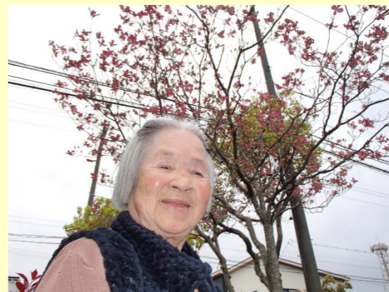
花みずきが咲いたわ!