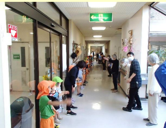
体操交流も続いています。