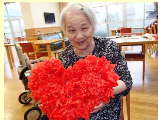
かわいくハートができたわ