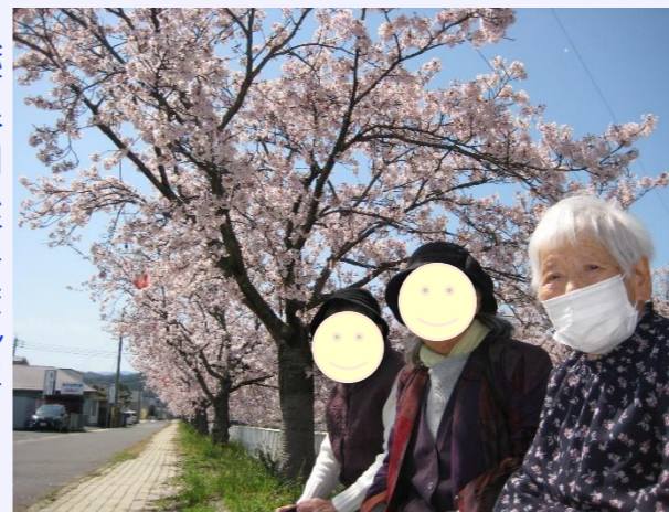
絵下谷川へ行きました♪