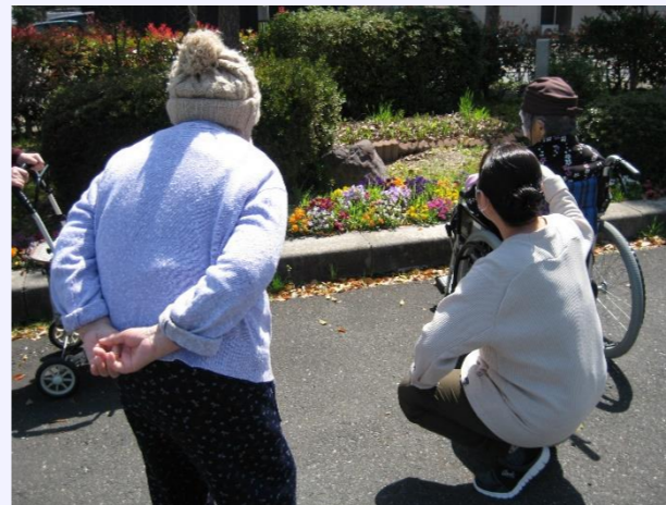
パンジーが咲きましたね〜