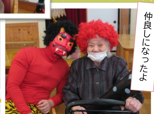
仲良しになったよ