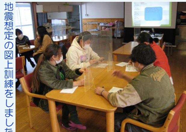
地震想定の上訓練をしました