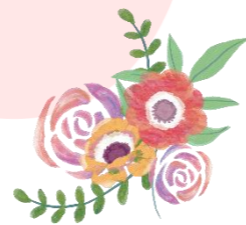
花を生ける時の真剣な表情も、完成した時の喜びの笑顔も、どちらも素敵です！