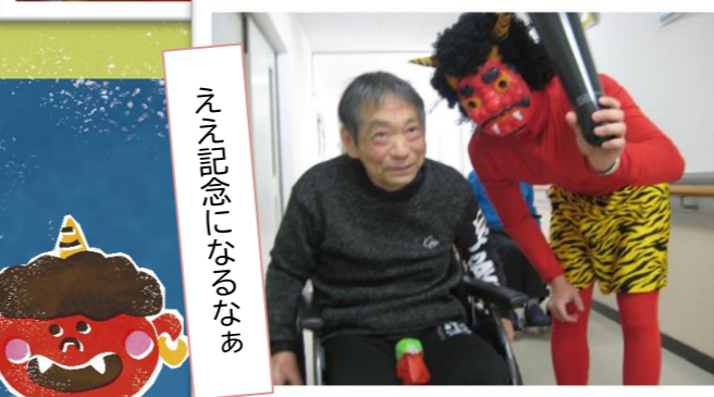
ええ記念になるなあ