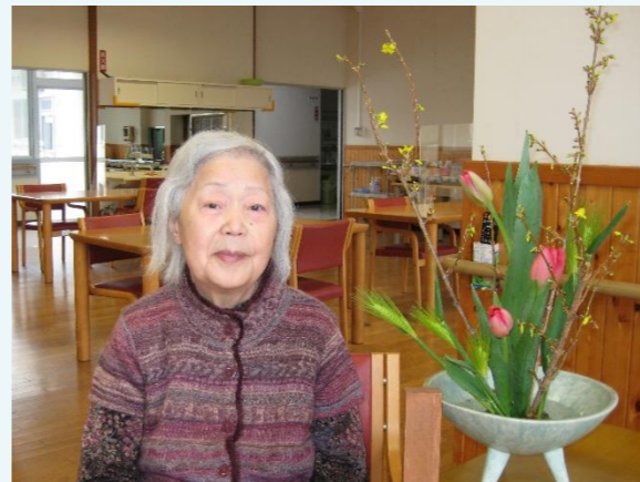
チューリップが可愛いわ