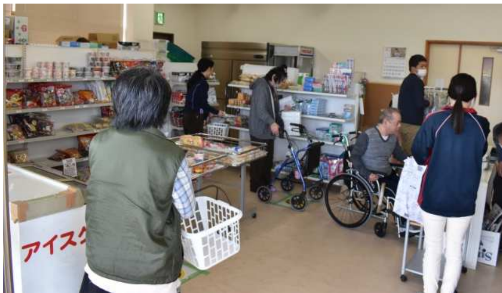
↓ご利用者による袋詰め作業の様子。 レジ打ちする職員のおそばに立ち、 一つひとつ丁寧に商品を袋に入れていきます。