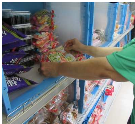
↑ご利用者による在庫チェック作業の様子