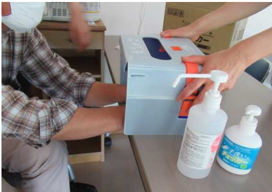
↑手洗いチェッカーをするご利用者