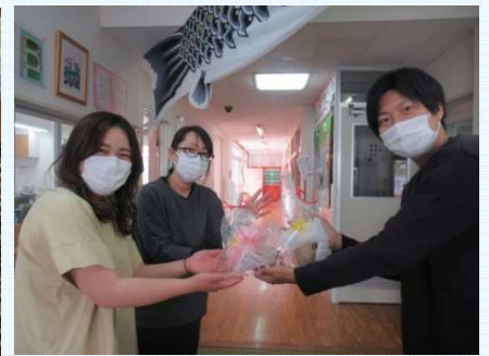
↑ババール園にプレゼントを持参しました