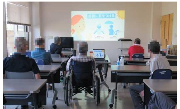
↑熱中症予防の啓発動画を視聴

ゆりはま大平園、ハッピーパーティーでは、年に2回、ご利用者に向けて手洗い研修を実施しています。