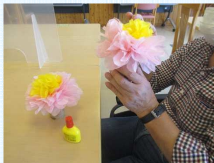
↑「難しいな…」と言いつつも…

この「作品交流」は、年間を通じて実施し、今後も、秋、冬と、季節にそった作品交流が続く予定です。