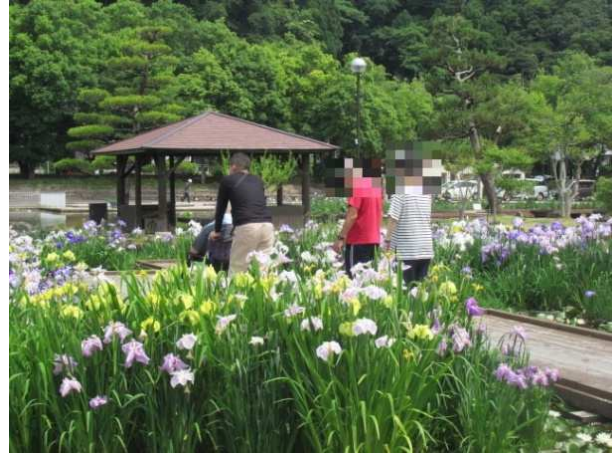
↑ゆったりと散策を楽しむご利用者たち。