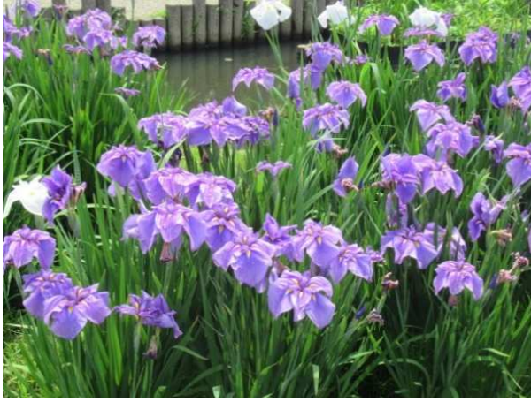
↑美しく咲き誇るあやめの花。ちょうど満開でした。

「とてもきれいだった」「あやめの良い時期に出かけられてよかった」と、満足の声が聞かれています。