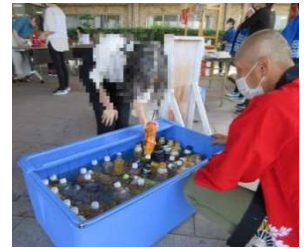
↑どのジュースにしようかな…

ちょうど梅雨明けが発表された7月20日、納涼会が開催されました。職員が目の前で焼き上げる特製たい焼き、フルーツポンチに、氷水でキンキンに冷えたジュースのつかみ取り