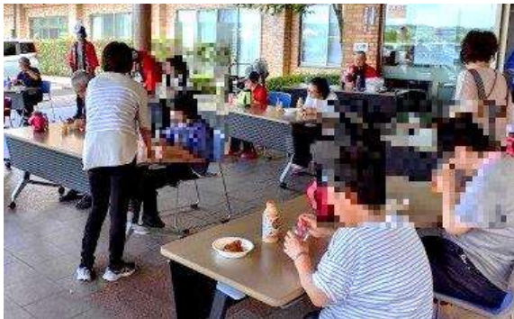
↑「外で食べるなんて、お祭りみたい」という声も

ちょうど梅雨明けが発表された7月20日、納涼会が開催されました。職員が目の前で焼き上げる特製たい焼き、フルーツポンチに、氷水でキンキンに冷えたジュースのつかみ取り