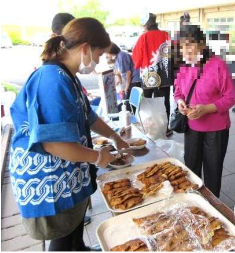
↑「焼きたてのたい焼きをどうぞ!」