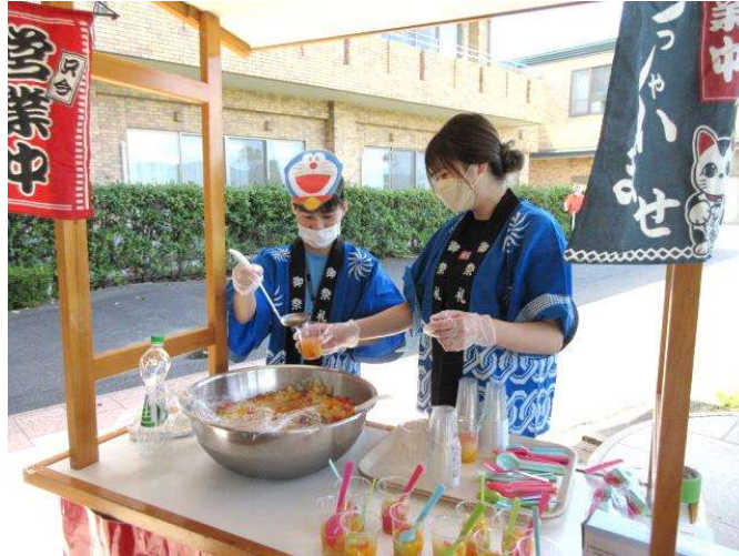
↑「おいしいヨ!フルーツポンチ、召し上がれ〜」