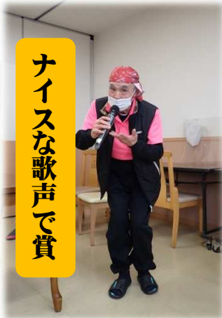
ナイスな歌声で賞