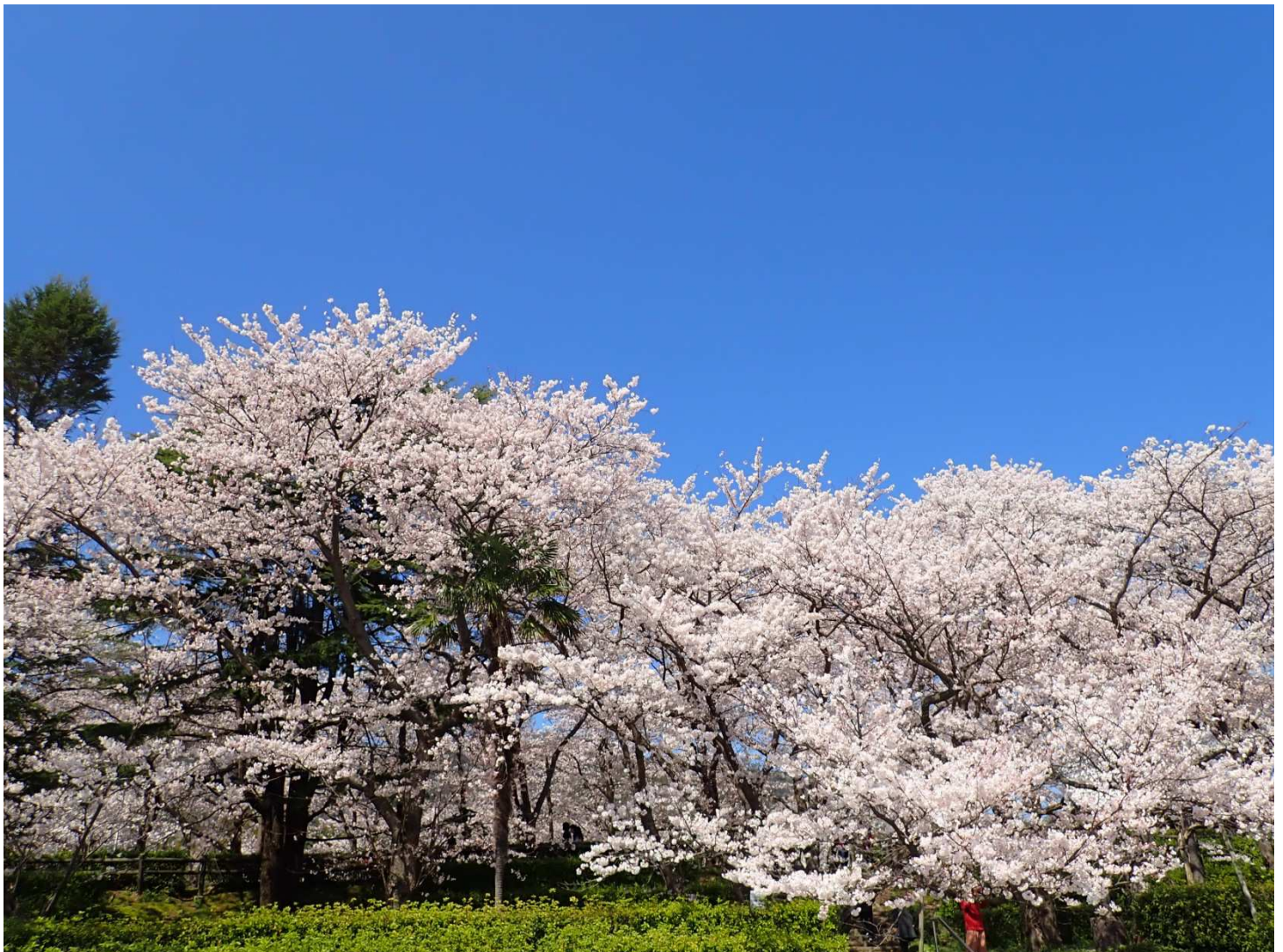
撮影場所: 台場公園

新型コロナウイルス感染の完全なる終息が未だ見えず、更には国外で起こった戦争に起因した食材や原油等の高騰による物価急上昇と、今や不測の事態により日常生活に行き詰りを感じている人も多く、誰もが突然生活困窮状態に陥ることも少なくありません。