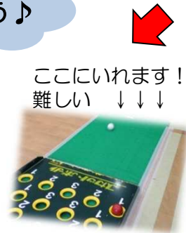
ここにいます！ 難しい ↓↓↓