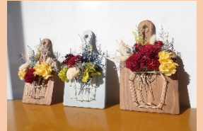
素敵な作品ですね♪