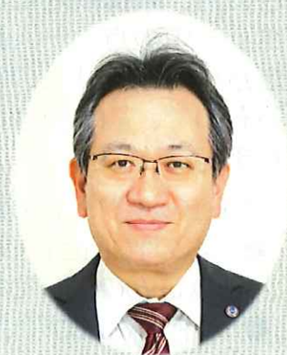
ル・ソラリオン 施設長

例年より早い桜の満開のもと令和3年度がスタートしました。昨年の挨拶では新型コロナウイルスを「持ち込まない、持ち込ませない、利用者を守る」を基本に感染対策に取り組むことを書かせていただきましたが、未だ感染の収束が見通せず感染対策を今年も継続することになることは想像できませんでした。コロナ禍の中、施設でご利用者が生活される環境が一変し、ご家族との面会、外部との交流は中止となり、ご利用者の皆様に楽しみや喜びを提供できる機会が無くなりご迷惑をおかけしました。今年度は、まだまだ収束は見通せませんが昨年の経験をもとに、職員の工夫により生活を楽しんでいただく環境を準備し、真にご利用者の満足を追求する介護を提供して、その人らしい生活が送れるように「その人」らしさを尊重し徹底したリスク管理（感染・災害・事故）と「人」づくりに取り組んでいきますので皆様のご理解、ご協力をお願い申し上げます。