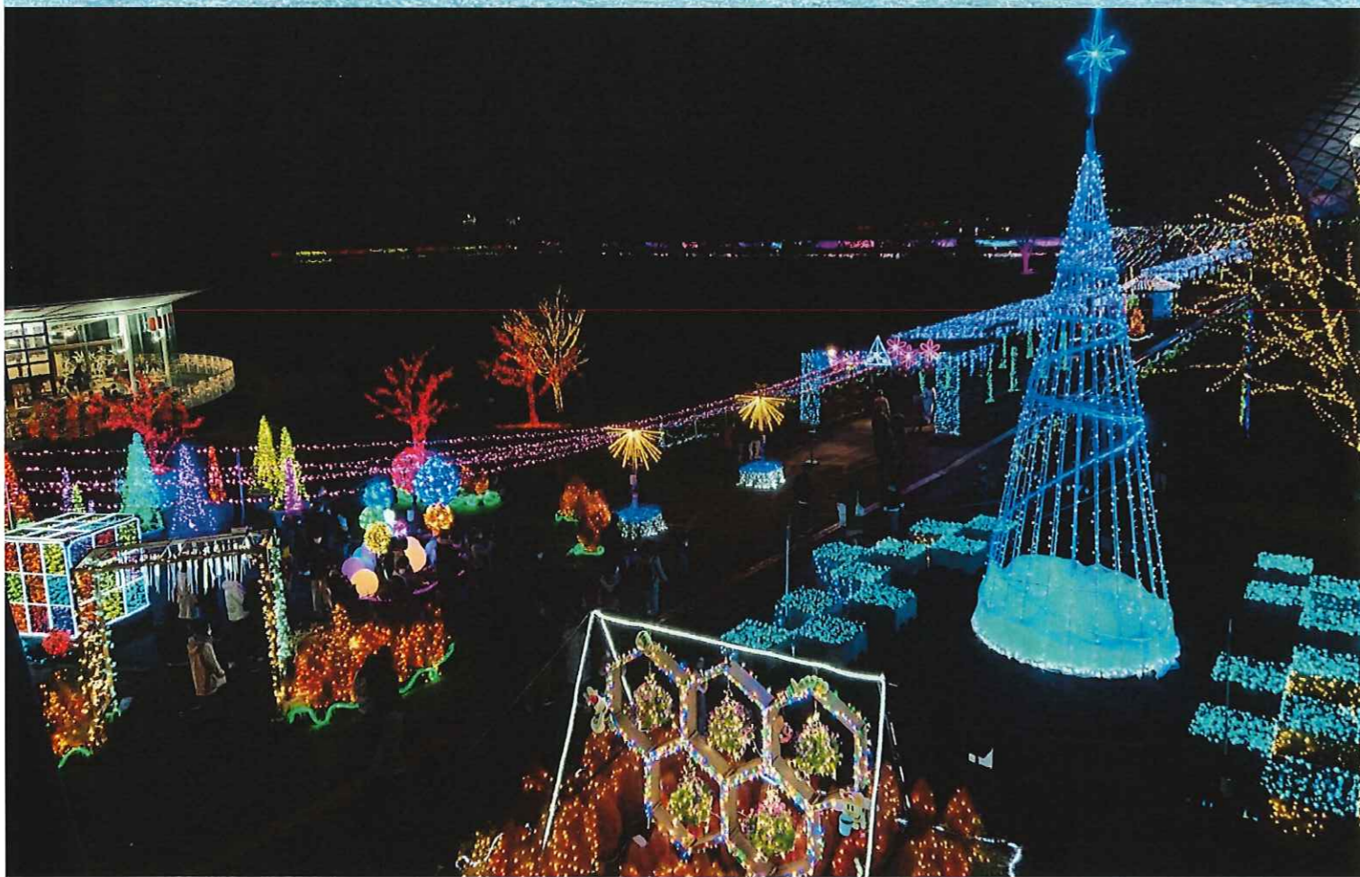
花回廊の華やかなイルミネーション