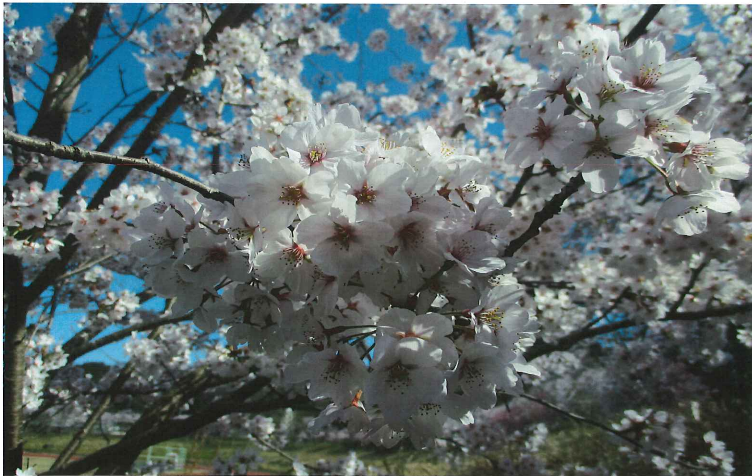
陽の光を受け 人目を引く華やかさで咲き乱れる桜