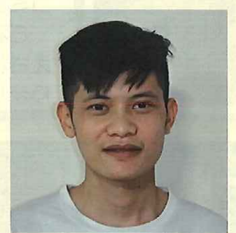
介護補助 オウアンティム

少しでも早く慣れるように、口より先に手を動かせるように頑張ります。休日は映画や読書、裁縫、筋トレなど楽しんでいます。