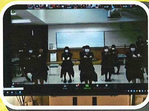
画面越しに一緒に体操