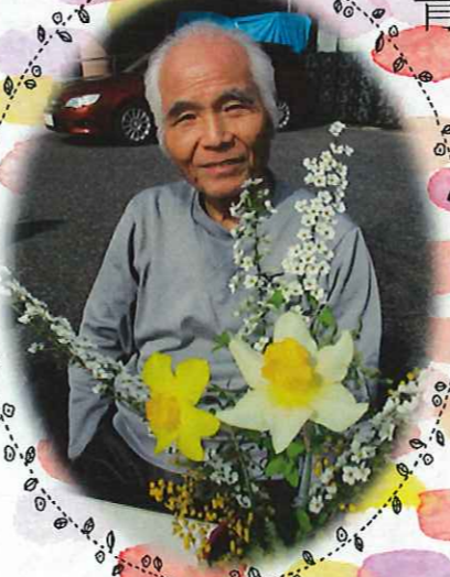
▲季節の花と一緒に

最近徐々に気温も上がり、春の温かさを感じられるようになってきました。平安東では春の陽気が心地良い日、ユニット玄関口前に机を運びお茶会を行いました。 普段とは違う場所でのコーヒーは一段とおいしく会話も弾み、いつも以上に楽しい会となりました。