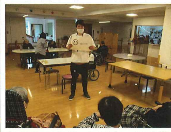
▲息を整えましょう～