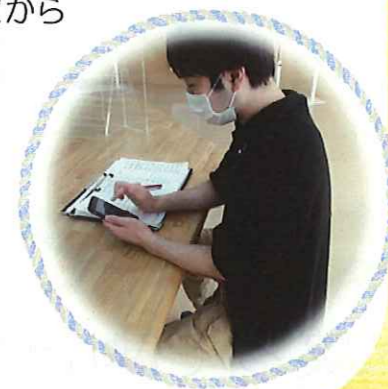
▲端末に気づきを入力