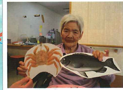
▲今晚のおかずです