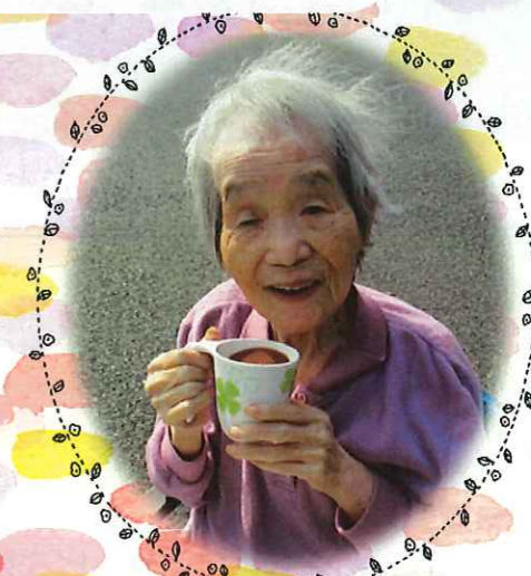
▲いつものコーヒーも格別に