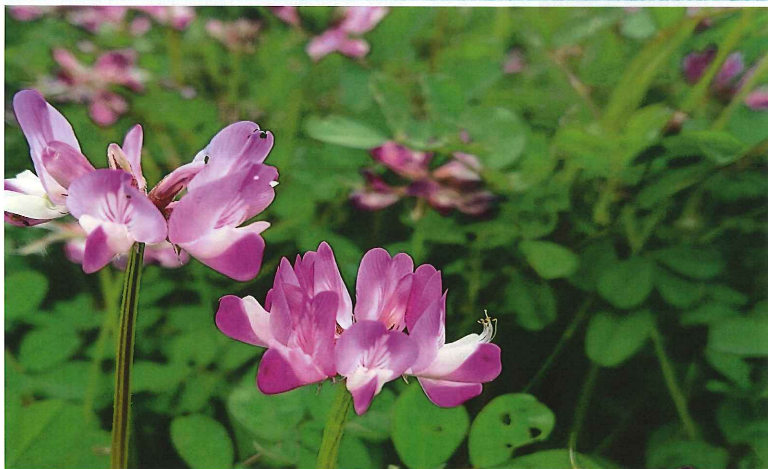
レンゲソウの花言葉「あなたと一緒になら苦痛がやわらく」