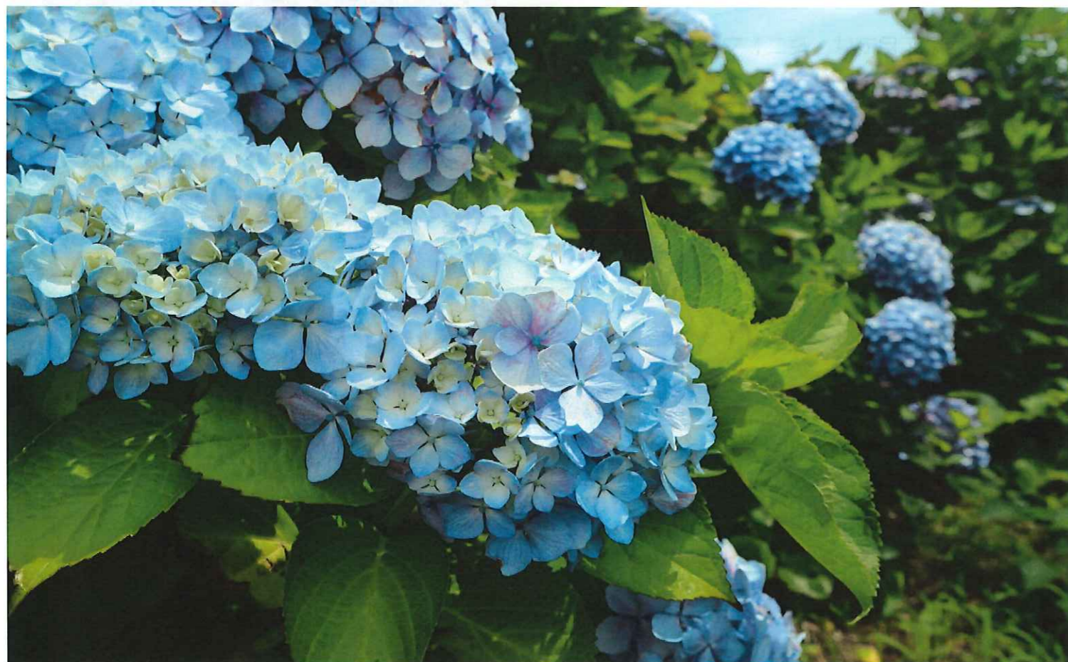
梅雨の時季に垣間見る鮮やかな紫陽花