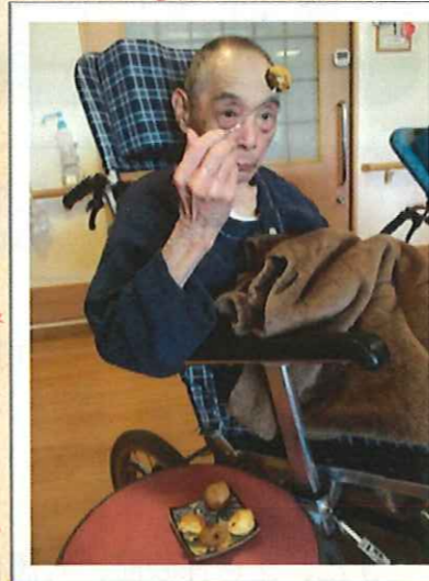
▲おかわりしますよ!