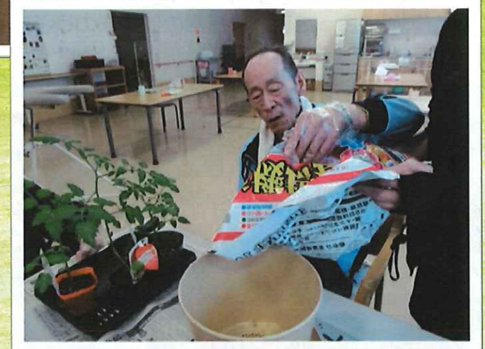
▲土はどれぐらいかいな～?