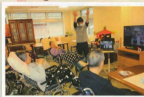
▲7フロアと同時に体操します〜

倉吉総合産業高校3年生活デザイン科の生徒さんとオンライン交流を行いました。生徒さん考案のレクリエーションは体操、手遊び、お手玉の的当て、クイズなど盛り沢山～ みなさんが頭も体も使い、交流を楽しめました。