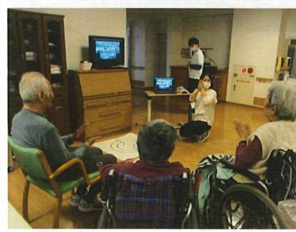
▲お手玉の的当てゲームで大盛り上がり！

倉吉総合産業高校3年生活デザイン科の生徒さんとオンライン交流を行いました。生徒さん考案のレクリエーションは体操、手遊び、お手玉の的当て、クイズなど盛り沢山～ みなさんが頭も体も使い、交流を楽しめました。