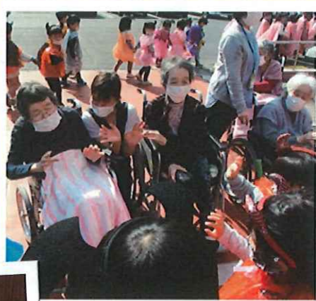
▲園児さんの可愛らしさに思わずにっこり

ババール園の園児さんがハロウィンパレードとして仮装姿で訪問してくださいました。園児さんの歓声で、みなさんも元気がもらえます！