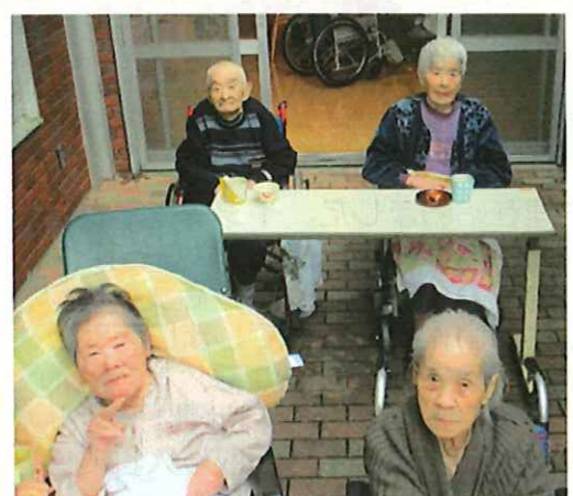
▲秋晴れの日にはテラスでお茶会