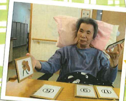
▲秋にちなんだ手作りカルタ