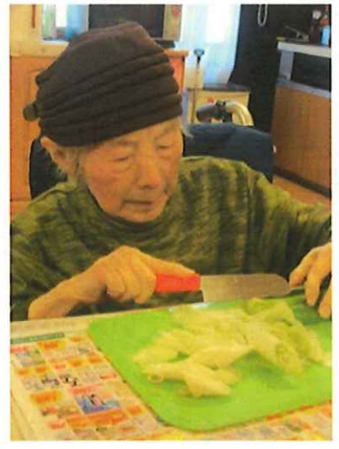
▲野菜を丁寧に切ります

今年も各フロアにて秋ならではの ごちそうをいただく！と味覚祭が開催されました。 さつまいもを使った芋きんとん、芋ようかん、 豚汁など・・・みなさんが「上手くできた！」 「また作りたい」と満足されていました。