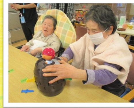
▲力を込めて慎重に

テーブルを囲んで「黒ひげゲーム」を行いました。 剣を刺していつ飛び出るかわからないスリルに皆様が盛り上がりおられました。