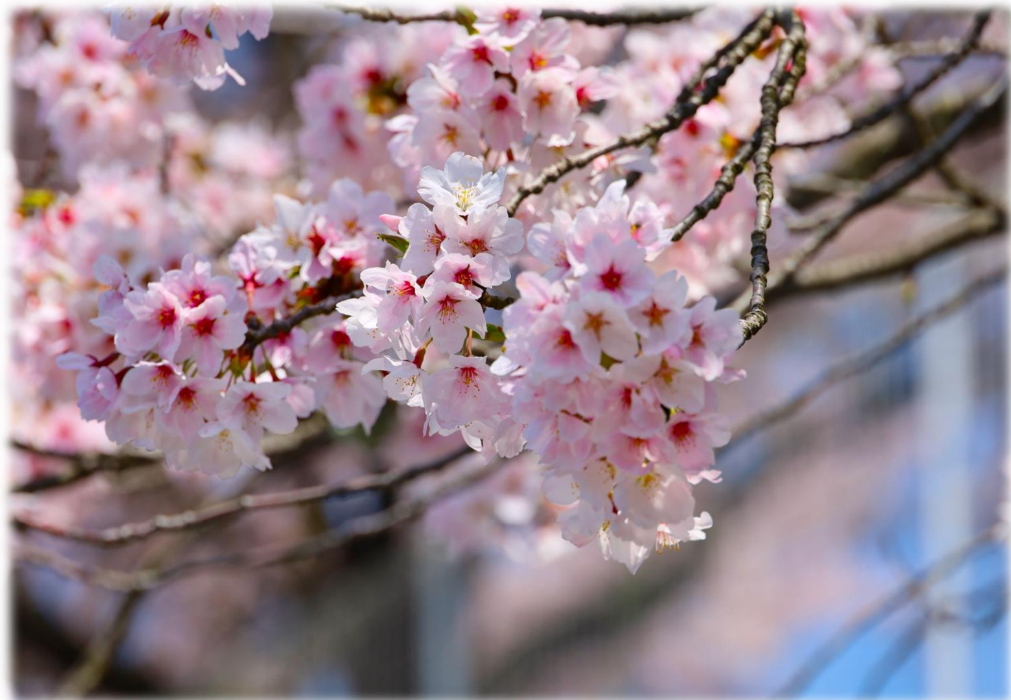
『いつも変わらぬ美しさ』 撮影者：N