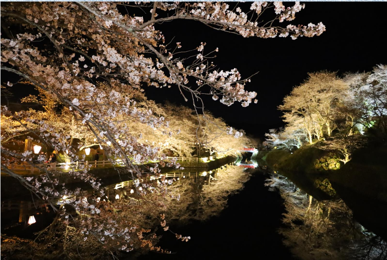
水面に映る夜桜、鏡の如く