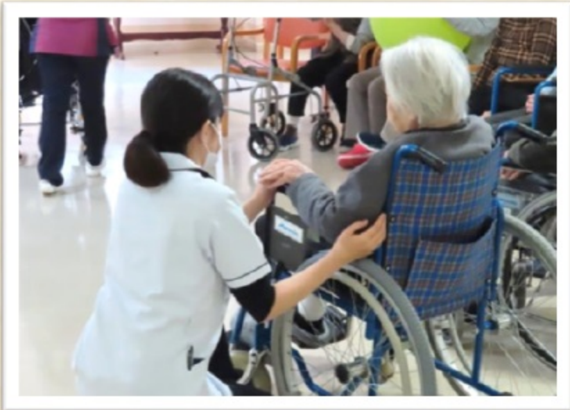
実習中の学生さん （患者さんとコミュニケーション中）