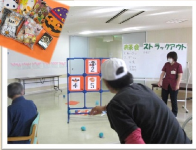
的あて（ハロウィン行事 5階病棟）