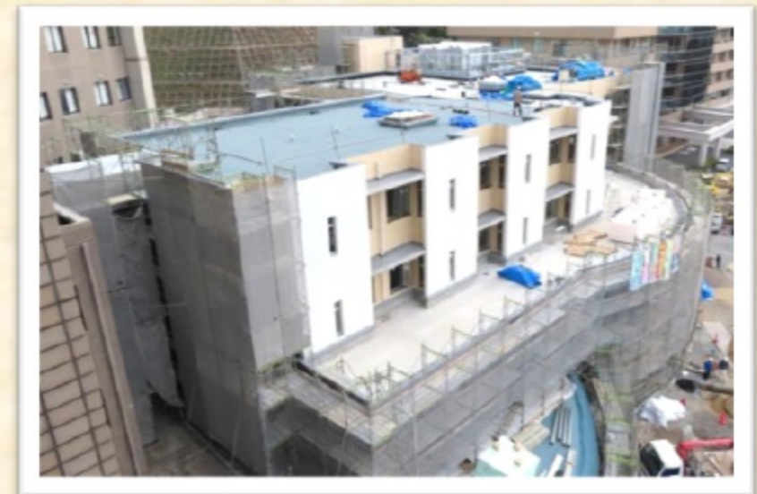
中央棟増築（12月8日時点） 来年2月に外来アゼリア・デイケア がリニューアル移転する予定