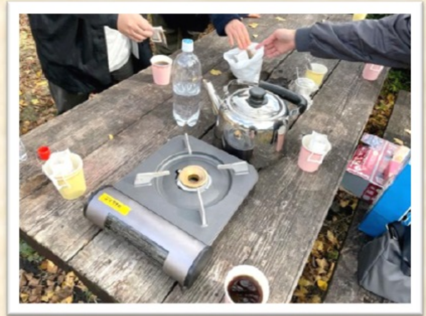
デイケア・集団プログラム「てくてく」で ストレスコーピング（11月） 長谷名水を使ってホット一杯