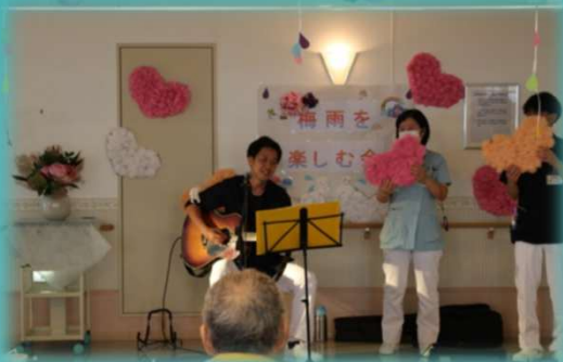
ギターによる弾き語り

緩和ケア病棟では、職員によるコンサートを行いました。ギターの演奏に合わせた歌声で安らぎの気分を味わうことができました。知っている曲が流れると一緒に口ずさむ患者さんの姿も見られました。