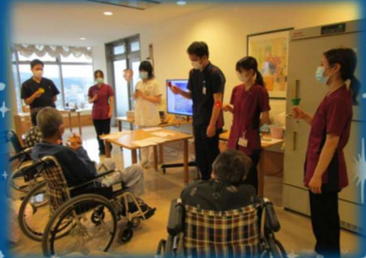
ハンドベルの演奏