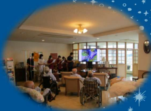
七夕について読み聞かせ

7月7日、七夕会を開催しました。3階病棟から5階病棟までそれぞれの階ごとに七夕の読み聞かせとハンドベルの演奏が行われました。参加された患者さんからは「沢山練習されたのですか？すてきな演奏でした」とコメントをいただき盛り上がりました。こうしたイベントは入院生活の心の支えになっています。今後も季節に沿ったイベントを行っていきたいと思います。