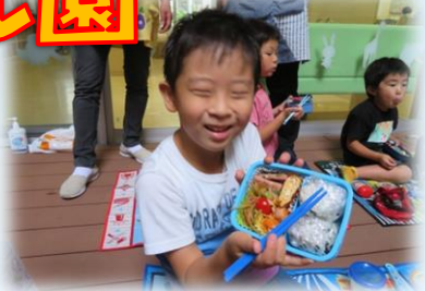
お散歩行ってきまーす☆