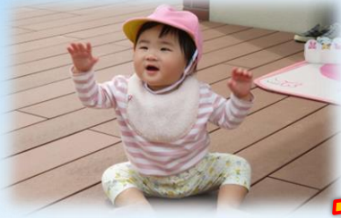
外気浴気持ちいいな～